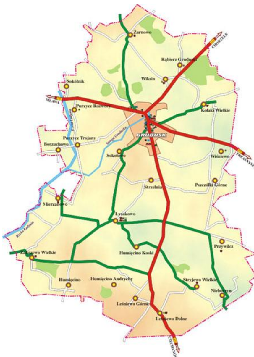
Mapa Gminy Grudusk